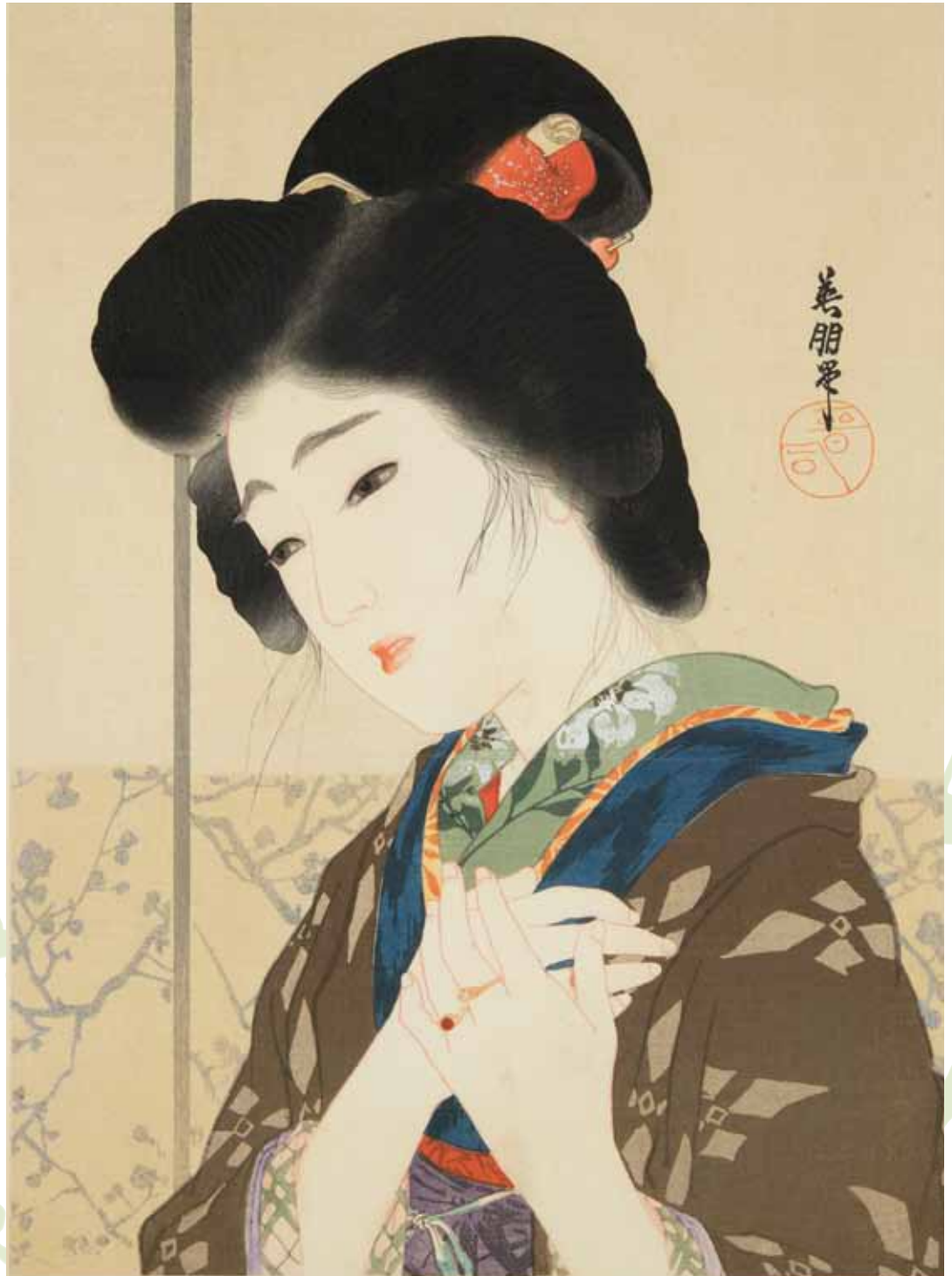
鱒崎英朋 柳川春葉・著「誓前編」口絵