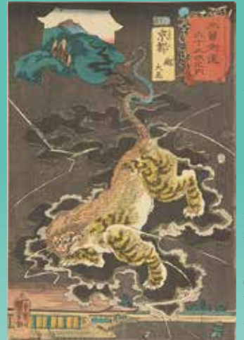
歌川国芳「木曾街道六十九次之内 京都 鶴大尾」(前期)