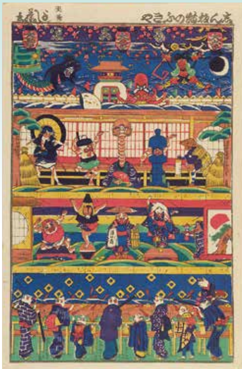
歌川芳藤「しん板猫のふきや」(後期)

浮世絵にはさまざまな動物や妖怪が登場します。ペットとして可愛がられているネコやイヌもいれば、不気味で恐ろしい姿をした鬼や土蜘蛛もいます。さらに、擬人化された動物たちや、奇妙なかたちをしたユーモラスなキャラクターまで、その描かれ方は実にさまざまです。