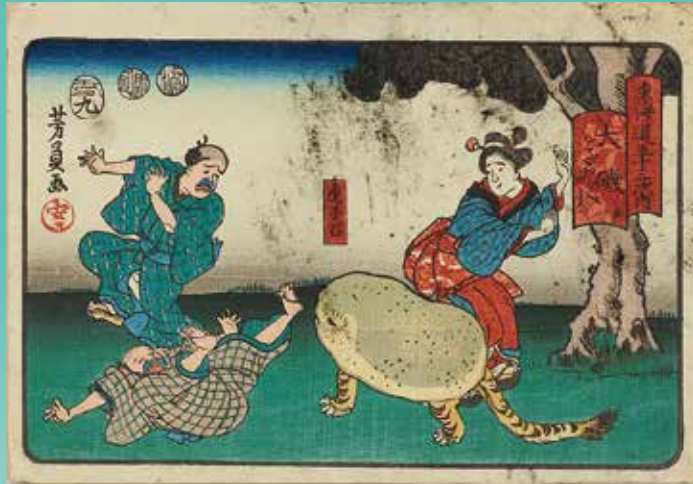
歌川芳員「東海道五十三次内 大磯をだらへ四り」(前期)