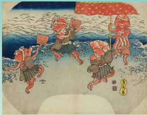
歌川貞秀「蛸踊り」(後期)