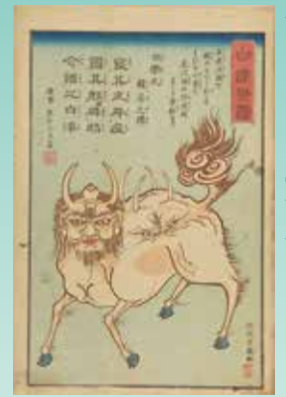
梅素亭玄魚「白澤之図」(前期)