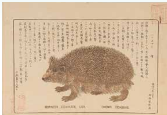
服部雪斎「ハリネズミ」(後期)