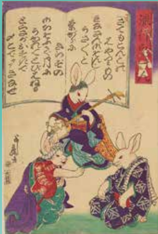
歌川芳藤「流行兎けん」(前期)