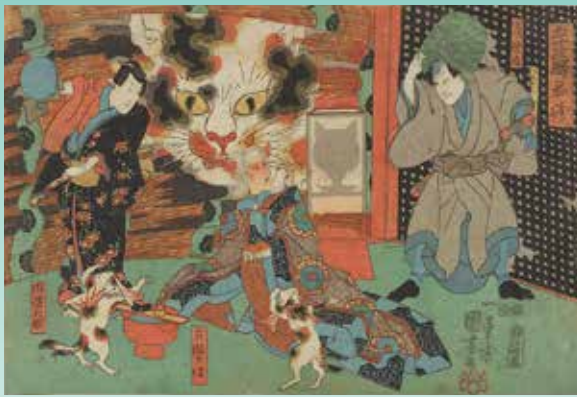
歌川国芳「五十三駅 岡崎」(後期)