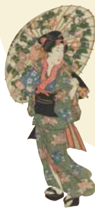
歌川国貞 「今世斗計十二時 未の刻 日ノハツ時」(後期)