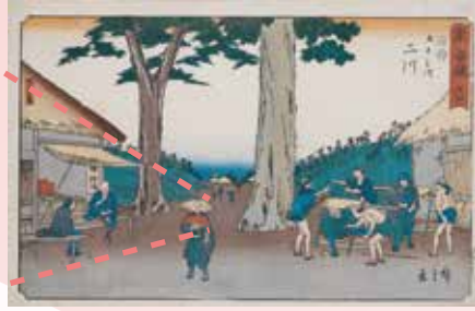
歌川広重「東海道 卅四 二川 猿か馬場」(前期)