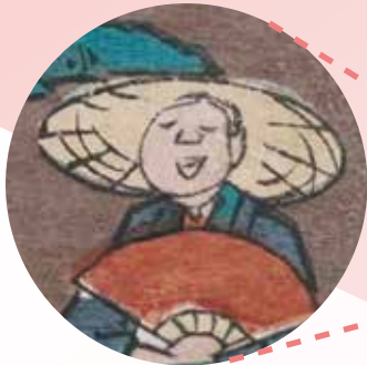
味わい深いおじさん発見!