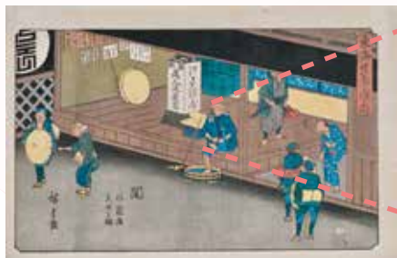
歌川広重「東海道五十三次之内 関 旅籠屋見世之図」(後期)