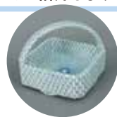
染付 網目文 手鉢 伊万里 江戸時代(18世紀後半)

本展の半券を戸栗美術館の上記展覧会でご提示いただくと、200円割引でご覧いただけます。また、上記展覧会の半券を当館でご提示いただくと、本展を100円割引でご覧いただけます。※1枚につき1名様、1回限り有効。他の割引との併用不可。